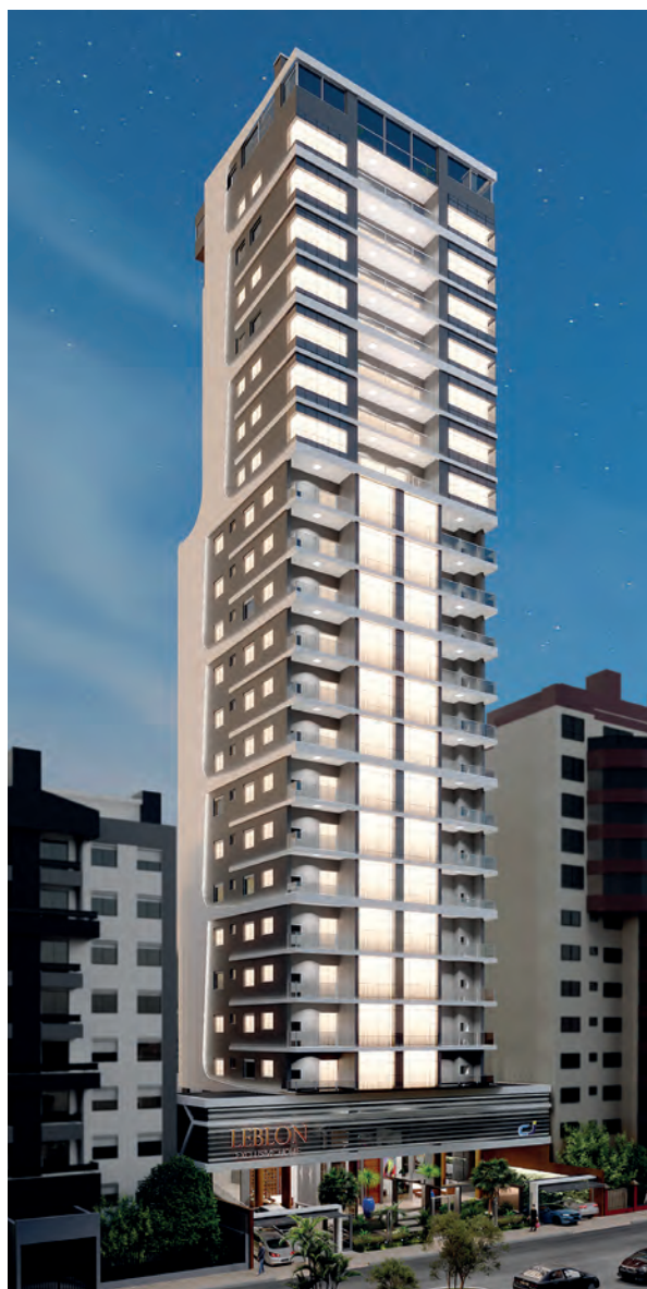
Leblon Exclusive Home Carazinho

Entrando 2021 com o pé direito, a Construtora apresentou para Carazinho, um dos mais modernos edifícios já construídos pela empresa: o Leblon Exclusive Home. Com 25 andares, sendo 4 andares destinados a box de garagem, 13 com dois apartamentos por andar, 7 com um apartamento por andar e no 25º andar o Rooftop com Área Gourmet e Espaço Pub. O prédio será o mais alto da cidade e contará com energia fotovoltaica e automação para as áreas comuns, isolamento acústico entre os andares, janelas antirruídos, salão de festas, espaço kids, academia, bicicletário, dentre muitos outros diferenciais.