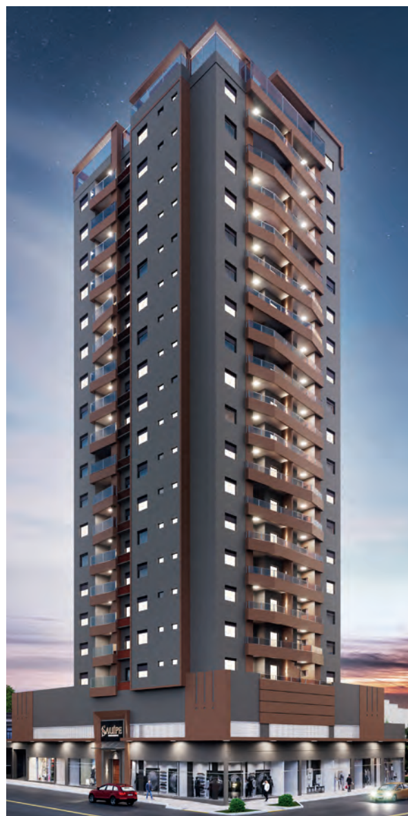
Sauípe Residence Ibirubá

Em março de 2021 foi a vez de mais um lançamento na cidade de Ibirubá. O Sauípe Residence, chegou para valorizar ainda mais a esquina da Rua Serafim Fagundes, com a Avenida Sete de Setembro. Esse residencial contará com 5 salas comerciais e 68 unidades de apartamentos, sendo quatro apartamentos por andar e, ainda, dois salões de festas na cobertura, que se localizará a 70 metros de altura. Tudo isso para proporcionar a melhor vista da cidade, tanto do nascer quanto do pôr do sol, e uma experiência única de viver bem. Esses Empreendimentos consolidam a trajetória da empresa até aqui.