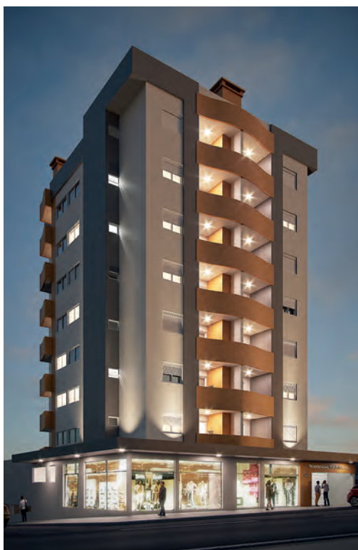
Residencial Mariscal Não-Me-Toque