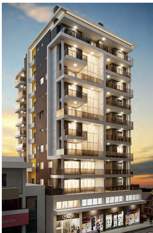
Residencial Angra Não-Me-Toque