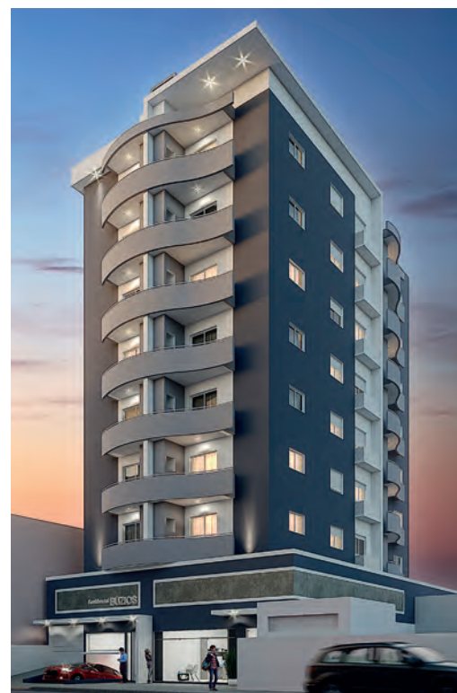
Residencial Búzios Carazinho