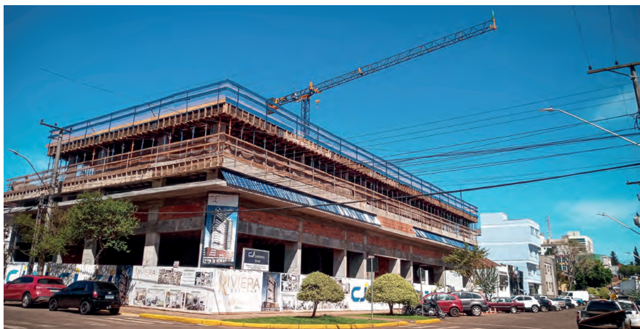
Grua na obra do empreendimento Riviera Village, em Ibirubá

A cada ano, a CJ Empreendimentos entrega mais de 6.000m 2 de obras, e para o futuro próximo estima-se a construção de, no mínimo, mais 20.000m 2 entre as cidades de atuação.