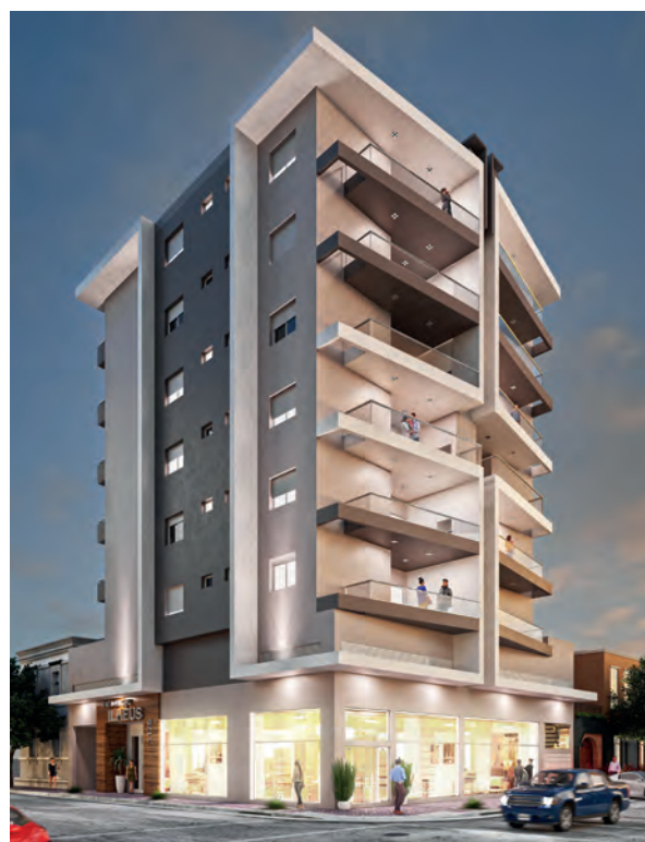
Residencial Ilhéus Ibirubá

Em 2018, a construtora lançou o Residencial Ilhéus, o primeiro no município com a marca da Construtora Josué, o qual conta com 12 unidades de apartamento e uma ampla sala comercial. Seguindo nessa crescente, foram lançados os Residenciais Angra, com 23 unidades de apartamentos e uma sala comercial, e Mariscal, com 21 unidades de apartamentos e 2 salas comerciais, em Não-Me-Toque, e o Residencial Búzios, com 21 unidades de apartamentos e 1 sala comercial, em Carazinho, Empreendimentos que marcaram a comemoração dos 25 anos da empresa. Todos empreendimentos únicos e repletos de detalhes para encantar seus futuros moradores.